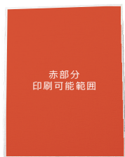
赤部分 印刷可能範囲

※フルカラー全面印刷ですが、製品フチ部分に若干の余白が来てしまいます。予めご了承のほどお願い致します。